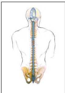
1 - המערכת הקרניוסקראלית

כינו השיטה: קראנו סקראל" מזכיר שני איברים בגוף: הקראניום (הגולגולת) והסקרום (עצם העצה). הם ממוקמים בשתי קצוות עמוד השדרה, ושלושתם (הגולגולת, עמוד השדרה והסקרום), אורזים בתוכם את מערכת העצבים המרכזית. בתוך המבנה הגרמי, קיימת הגנה נוספת: שלוש שכבות של קרומי המוח (Meninges). החיצונית שביניהם נקראת Dura mater. היא בלתי חדירה למים ולוכדת בתוכה נוזל הנקרא Cerebro Spinal Fluid (CSF) שמהווה עבור מערכת העצבים המרכזית סביבה נכונה לתפקודה האופטימאלי. ה-Dura, ה-CSF ועצמות עמוד השדרה והגולגולת אליהם ה-Dura מחוברת מהוות את מערכת הקרניוסקראלית – (CSS) cranio sacral system. (איור מס. 1).